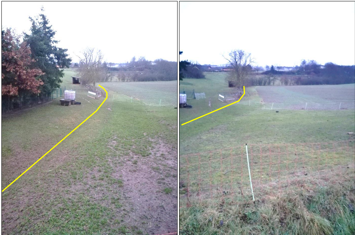
Abbildung 4: Blick auf den Verlauf des Otzweiler Graben (gelb skizziert) als Mulde am östlichen Rand außerhalb des Geltungsbereichs (angrenzend zu einem grasbewachsenen Wirtschaftsweg)

Gehölzbestände sind innerhalb des Geltungsbereichs nicht vorhanden. Der Otzweiler Graben wird nach Süden hin teilweise von einem Feldgehölz begleitet.