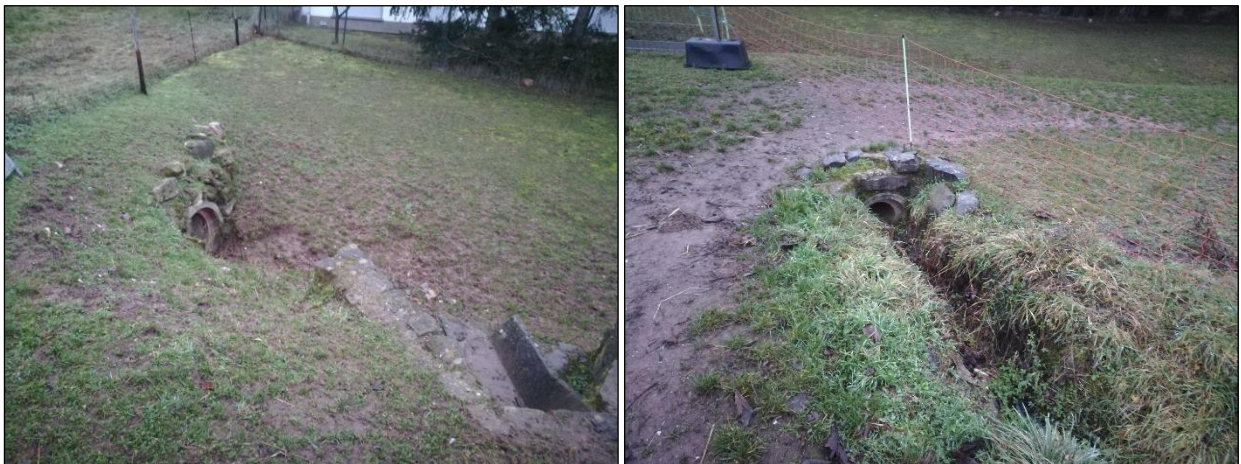
Abbildung 3: Blick auf das Ende der Verrohrung des Otzweiler Grabens (unterhalb der Römerstraße) (Foto links) und Verrohrung des Versickerungsgrabens im Zufahrtbereich auf die Weide unterhalb des Wirtschaftsweges (Foto rechts)

Der Otzweiler Graben östlich des Geltungsbereichs verlaufend ist unterhalb der Römerstraße verrohrt (siehe Abbildung 3, Foto links). Die Verrohrung endet in Richtung Süden. Der Versickerungsgraben ist ebenfalls unterhalb der Wirtschaftsweges im Zufahrtbereich der Weide verrohrt.