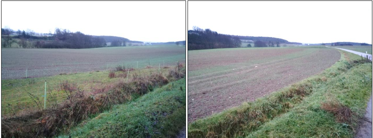
Abbildung 2: Blick auf die eingezäunte Weidefläche (Bildvordergrund, Foto links) und Ackerfläche (Bildhintergrund und Foto rechts)

Das Plangebiet setzt sich vorwiegend aus Ackerfläche sowie zu geringem Anteil aus Grünland (Weidefläche) zusammen, welche jeweils intensiv genutzt werden (siehe Abbildung 1). Im Bildvordergrund ist jeweils der naturfern ausgeprägte Versickerungsgraben -südlich an die Römerstraße angrenzend- zu erkennen.