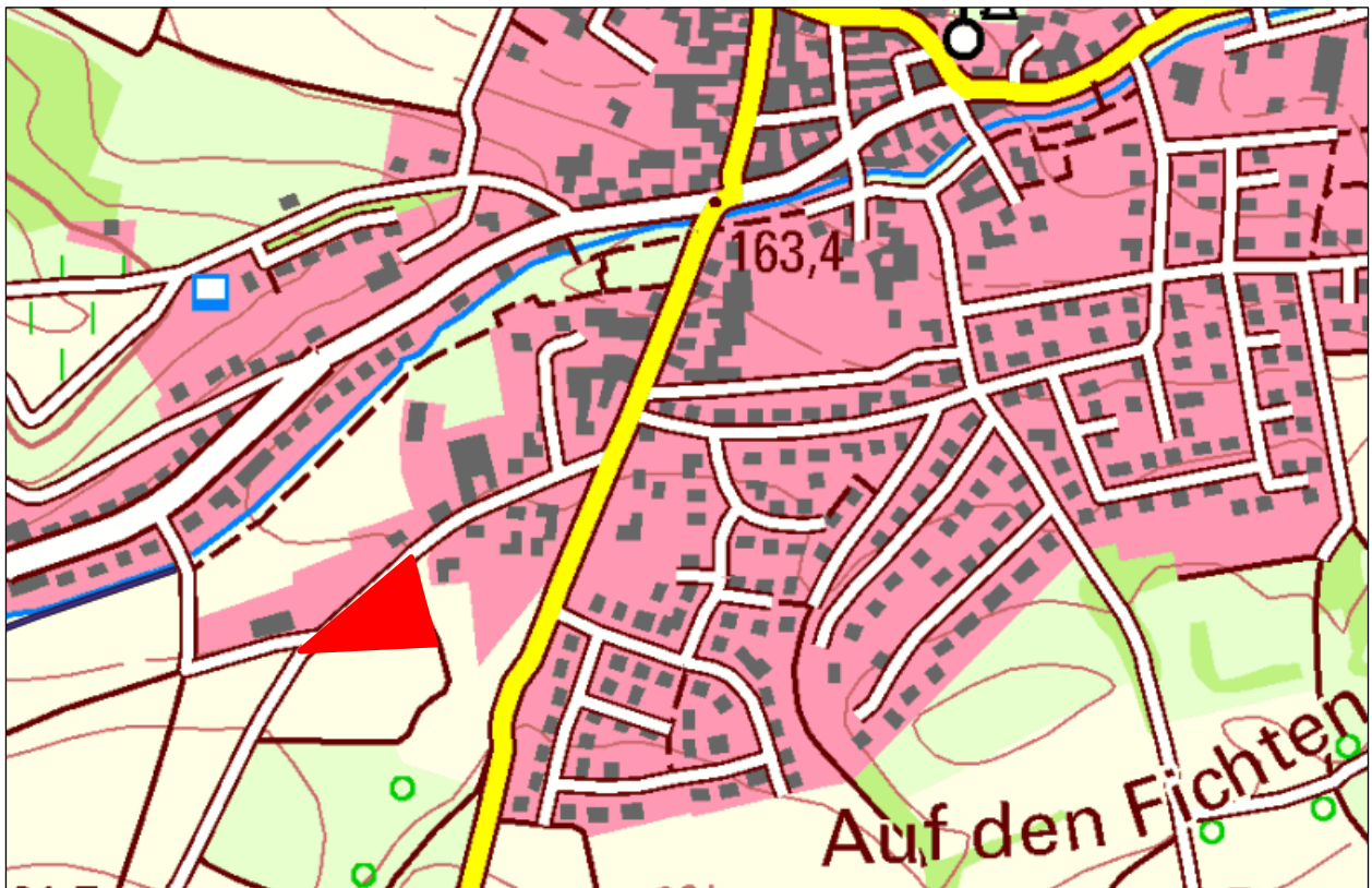
Abbildung 1: Verortung des Geltungsbereichs (rot skizziert) südwestlich von Meddersheim

Der Geltungsbereich befindet sich am südwestlichen Ortsrand von Meddersheim (siehe Abbildung 1), innerhalb des Messtischblatts (MTB) TK-25 Nr. 6211 (Bad Sobernheim) bzw. dessen nordöstlichen Quadranten 6211/2.